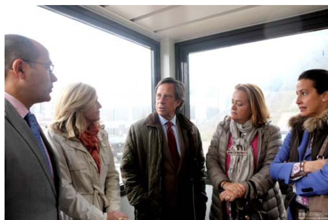
Visita del Alcalde el día de entrada en servicio de las casetas