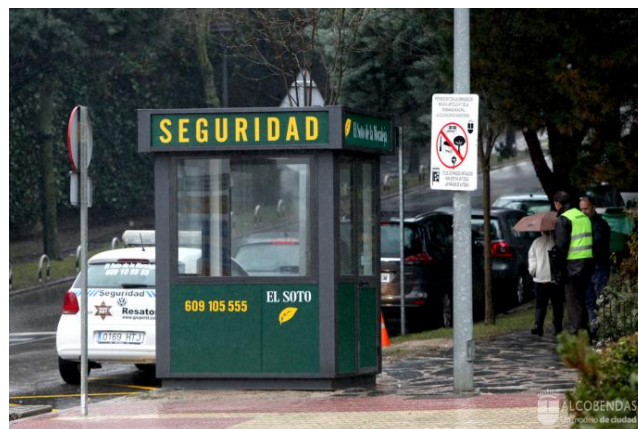
Acceso por calle Nardo

Se trata de módulos prefabricados de diseño análogo al de nuestra urbanización vecina, La Moraleja, reforzándose de este modo la percepción de seguridad y coordinación entre servicios de vigilancia.